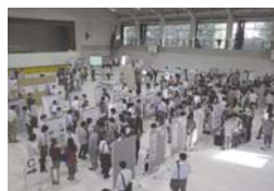
2013年10月2日(水)開催の様子

本フォーラムでは、システムデザイン学部・研究科の研究成果の公開、関係機関との交流を目的とし、例年、外部講師・教員による研究発表・討論会、学生による研究発表・ポスター発表等を行っています。詳しくは、システムデザインフォーラムホームページでご確認ください。