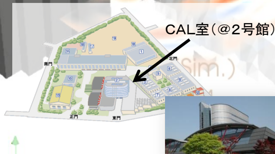
日野キャンパス内マップ