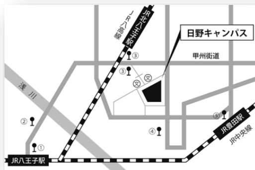
日野キャンパスへのアクセス

主催： 学際融合型先進コンピューティング・リサーチコア 共催： 波動情報工学研究室（電子情報システム工学科）