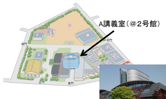
日野キャンパス内マップ