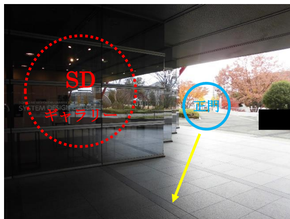
SD ギャラリーは正門からまっすぐ進み