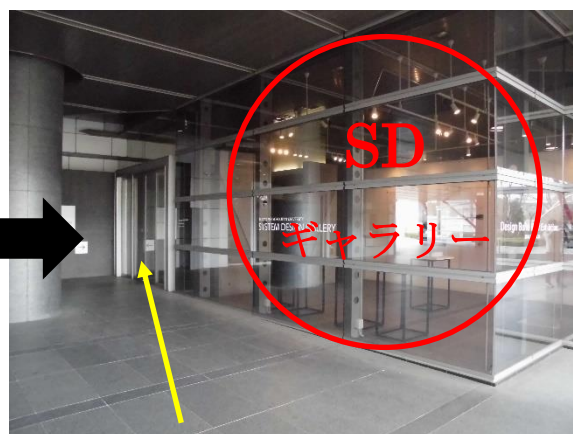
右手に見えるガラス張りのスペースです