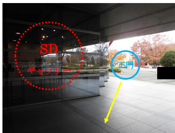
SD ギャラリーは正門からまっすぐ進み